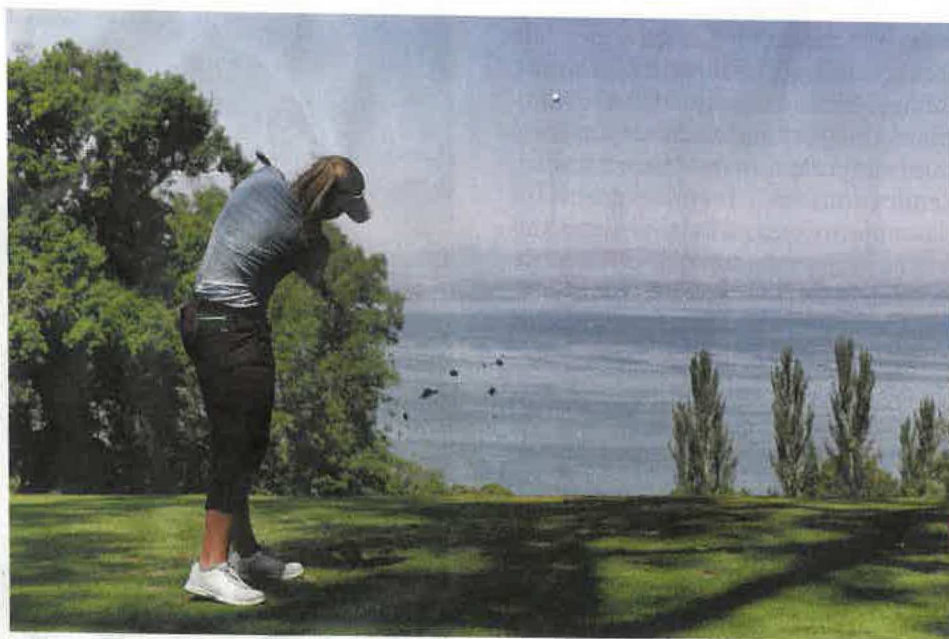
Le départ du trou n° 2 de l'Evian Resort et sa vue sur le lac Léman.

Avec les revenus générés par l'organisation du tournoi, le Resort d'Évian bénéficie de moyens que peu de golfs ont. Afin de limiter la consommation en eau du parcours et de pouvoir répondre à l'interdiction totale de l'usage de produits chimiques à partir du 1 er janvier 2025, un programme de changement de graminées sur les greens a été lancé il y a cinq ans déjà. La nouvelle herbe, de l'agrostis, est moins gourmande en eau, résiste mieux aux fortes chaleurs et développe moins de maladies. Déjà effectif pour 70 % de la surface, ce programme va se poursuivre, sachant que