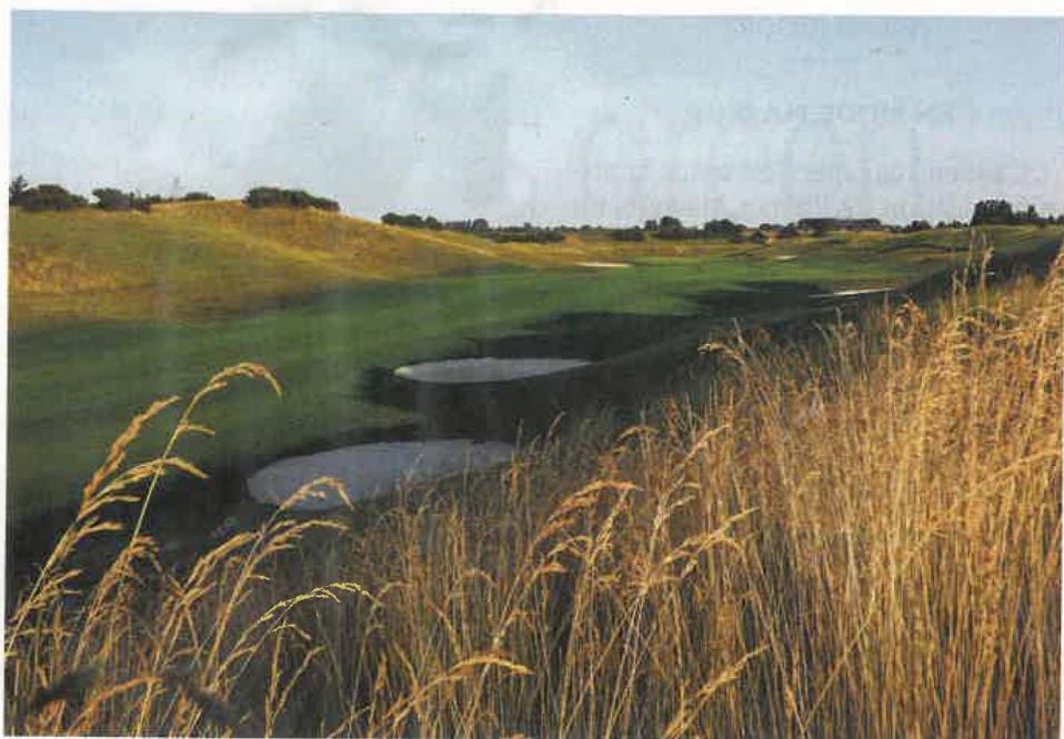
Près de Lille, le golf de Mérignies, au faible bilan carbone, abrite près de 200 espèces de flore et de faune.

Séjourner: Evian Resort. Hôtel Royal (5 étoiles palace), 131 chambres, 19 suites, 3 restaurants (La Véranda, L'Oliveraie, Les Fresques), à partir de 450 € la nuit. Hôtel Ermitage (4 étoiles), 74 chambres, 6 suites, 2 restaurants (La Table et La Bibliothèque), à partir de 200 € la nuit. evianresort.com