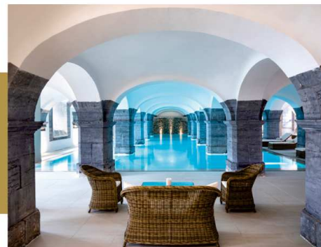
Le Spa by Royal Hainaut

L'abus d'alcool est dangereux pour la santé, à consommer avec modération. *Hors veilles de jours fériés, jours fériés et weekend. Tarifs sous réserve de validation du service réservation.