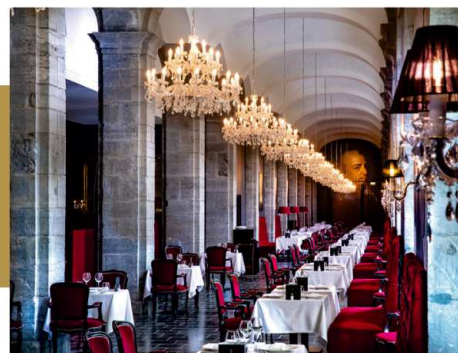
La Galerie, Brasserie de Tradition