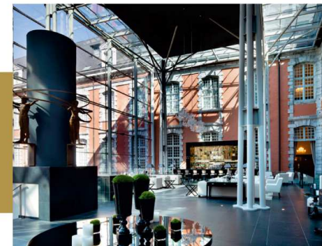
L'Atrium Bar Lounge